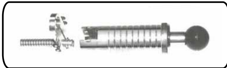
d) introducir la plantilla en el refrentador