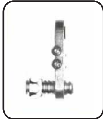
c) fijar en la plantilla el punto del tubo a cortar contando 2 espiras. Introducir la tuerca con la rosca hacia el exterior