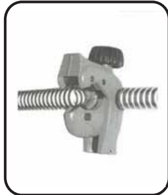
b) cortar el tubo con el cortatubo