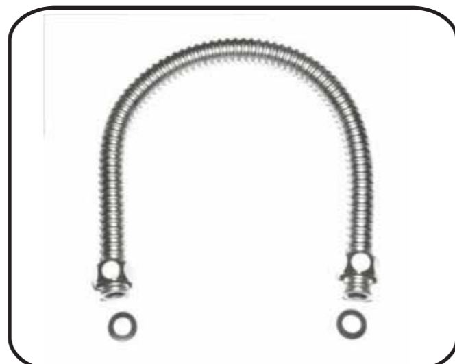
g) después de acabar con la embutición, colocar las juntas