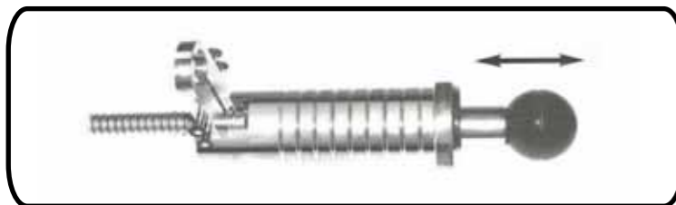
e) ejercer fuerte presión con el refrentador mediante varios golpes