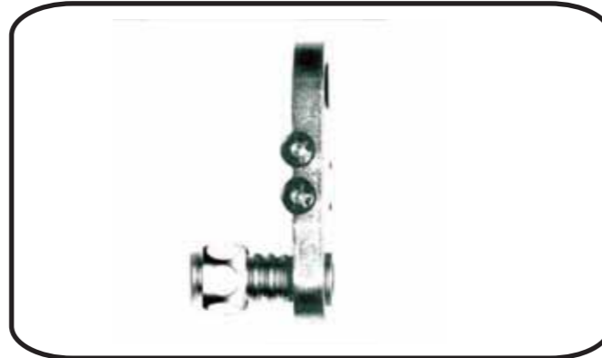
f) extraer la plantilla y controlar que las dos espiras hayan quedado lisas y uniformes. repetir la operación en la otra extremidad del tubo